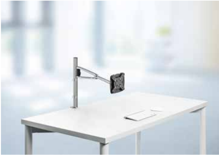
MY one plus 2.0 C, mit Systemzwingen, silber