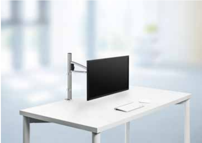
MY one plus 2.0 C, mit Systemzwingen, silber