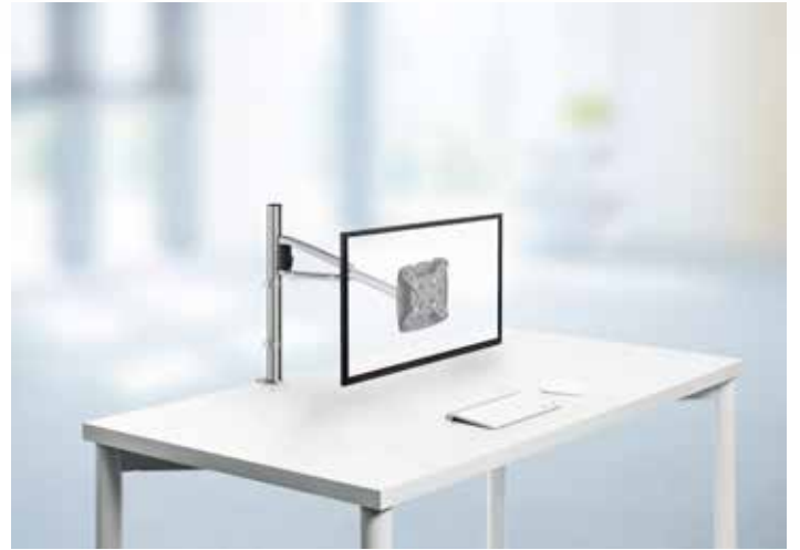
MY one plus 2.0 C, mit Systemzwingen, silber